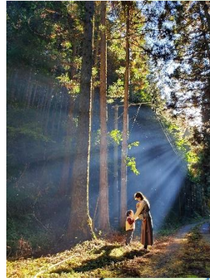
第3回 優秀賞 「健やかに育ってね」