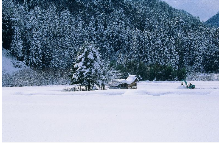
第3回 鹿野賞 「豪雪」