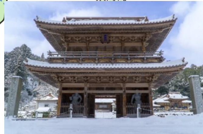
2018年度 最優秀賞 「常楽門」