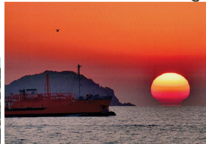
第2回 鼓南賞 「だるま夕日」