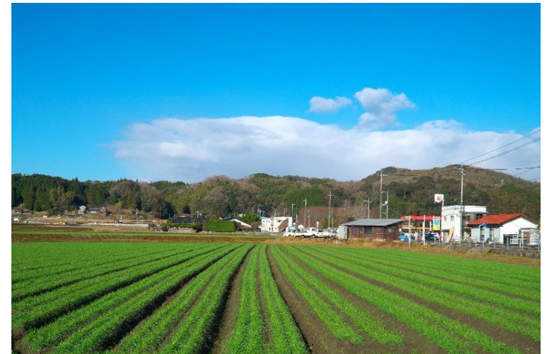
2020年度 最優秀賞 「幼麦ならぶ長畝」