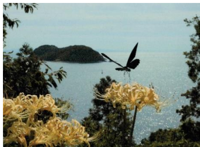
第2回 大島べっぴん賞 「古島と蝶」