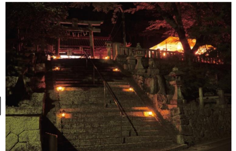
2019年度 最優秀賞 「夜の周方神社」