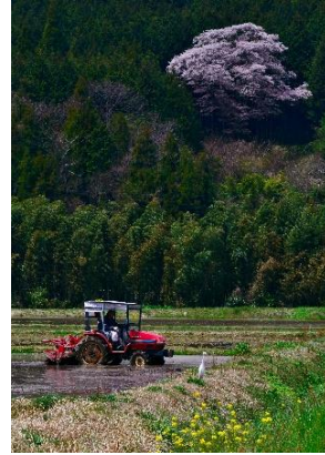
第3回 優秀賞 「桜に見守られて」