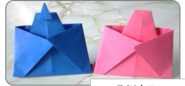
1月例会テーマ お雛様 (Doll)