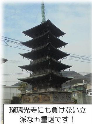
瑠璃光寺にも負けない立 派な五重塔です！