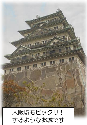
大阪城もビックリ！ するようなお城です