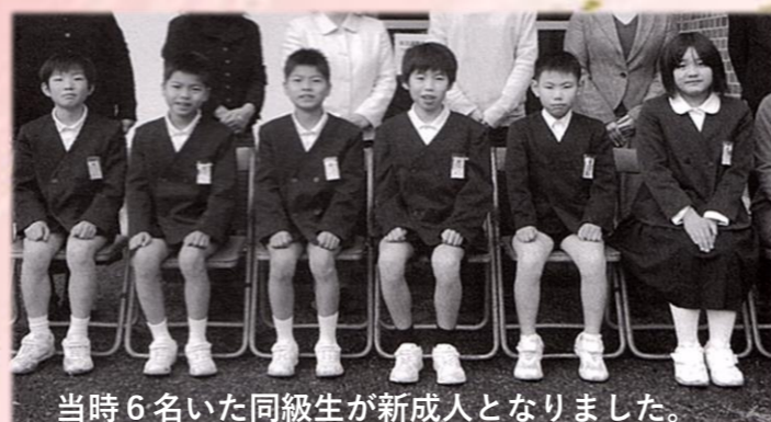
当時6名いた同級生が新成人となりました。

祝新成人 今年の新年会ができません。お披露目できません。5名の新人をご紹介いたします。