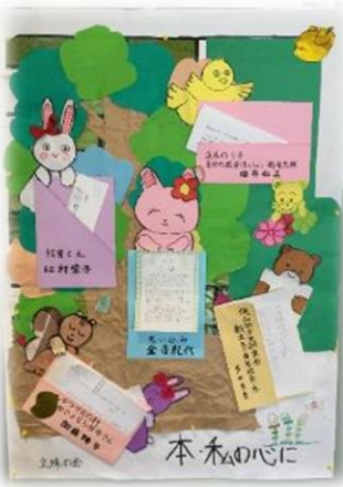
【「文殊の会」による展示】

1100mm×800mmのパネルを最大二面分ご利用いただき、1団体につき約1ヶ月間の展示ができます（※申込団体数が複数の場合は抽選）。展示物は団体のみなさんにご用意いただき、自由に展示していただけます。展示を希望される団体は、申込期間や展示期間などがございますので詳細を当センターまでお問合せください。