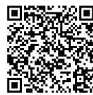
【グループバンク登録・申請方法】

掲載している機能をご利用いただけるのは、周南市市民活動支援センターグループバンク登録団体のみとなります。登録条件や、登録申請方法は右記QRコードよりご確認ください。