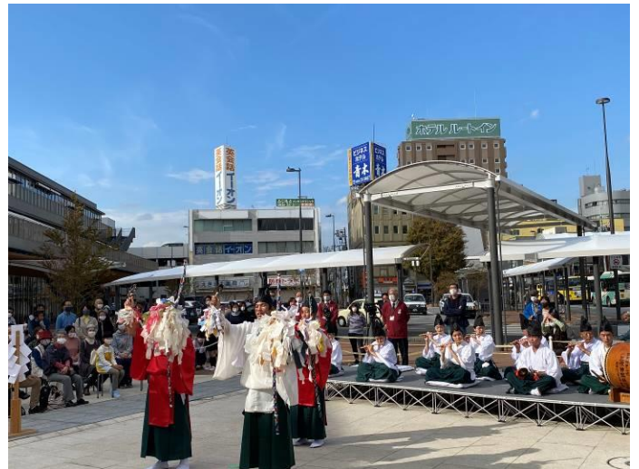
(和田中学校生徒による弓の舞)

1300年前から伝わる和田地区の伝統芸能である三作神楽が今年、国指定重要無形民俗文化財に登録されて20周年を迎えます。そこで、新しい生活様式に対応しながら、より多くの市民に伝統芸能を伝えたいという思いから11月1日に徳山駅前の噴水広場で披露されました。