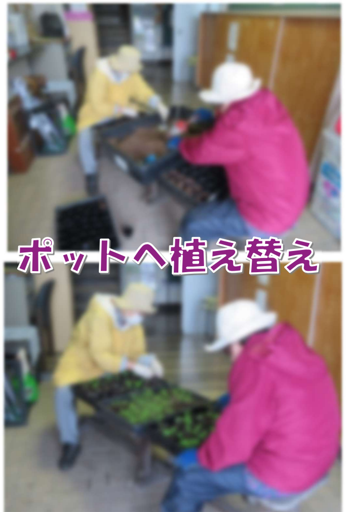
ポットへ植え替え

緊急事態宣言も解除されたところではございますが、それでも皆様まだまだ堪えるところがありながら、日々生活されていることと思います。