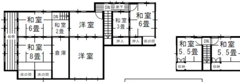
2階平面図 S = 1/100