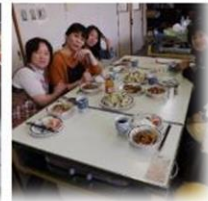
★パルー料理★ 周南市在住で、パルー出身のお料理上手な男性に指導していただきました。