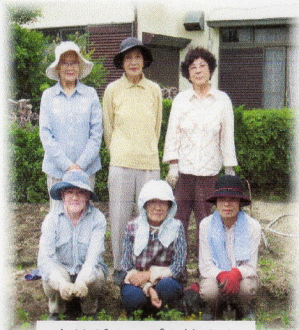
育苗グループの皆さん

周陽地区で唯一の育苗グループですから無理をされず、少しでも長く続けてもらいたいと思います。