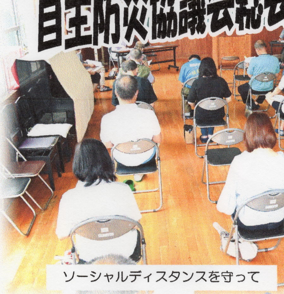
ソーシャルディスタンスを守って