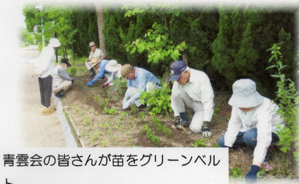
青雲会の皆さんが苗をグリーンベルト