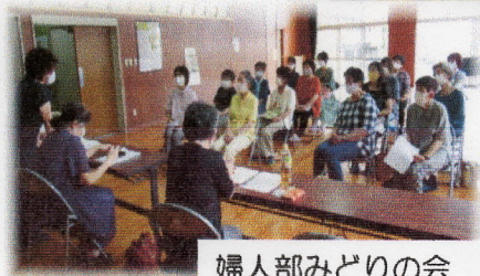
婦人部みどりの会