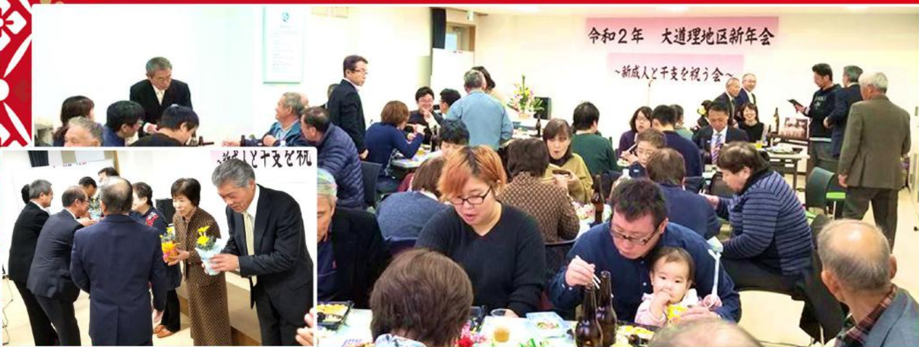
令和2年 大道理地区新年会