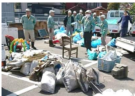
センターへ持ち帰った投棄ごみ

様々な団体が事業 を行なっています。 皆さんも地区行事 等に参加してみま せんか