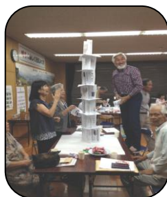
アイスブレイクの様子

毎月第4火曜日午後7時から桜木市民センターで桜木まちづくりの集いが開催されています。この集いは、地区住民のいろいろな困り事(課題)について、皆で知恵を出し合い、いつまでも住み続けられる、住みよい地域を目指して話し合いをする場です。9月はゴミ出し支援について話し合いました。次回は楽しい居場所作りについて話し合う予定です。自分達の住む桜木について、ざっくばらんに話し合いませんか。是非皆様のご参加をお待ちしています。