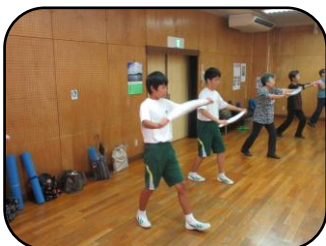
健康体操 ハピネス