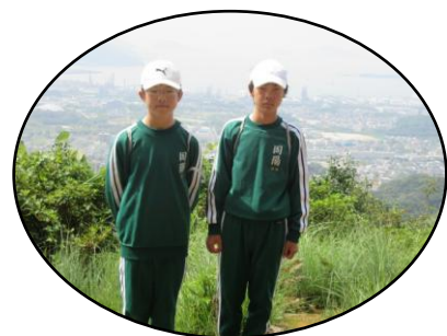
とおの山山頂から