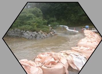
桜木地区自主防災協議会

自然災害に関する情報をこまめに収集し、早めに避難するなどの判断をすることが大切です