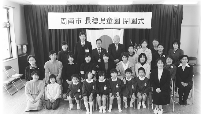
周南市 長穂児童園 閉園式