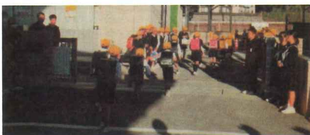
小中合同のあいさつ運動

新年あけましておめでとうございます。皆様には、常日頃から学校教育へ多大なるご支援をいただいております。教職員一同心から感謝申し上げます。久米小は、ご存じのとおり、地域とともにある学校「コミュニティ・スクール」です。たくさんの方の地域の方に学校へ来ていただき、子どもたちの姿を見て、直接「頑張っているね」と声をかけていただくことが自信につながります。今年も、たくさんの方のご来校をお待ちしています。