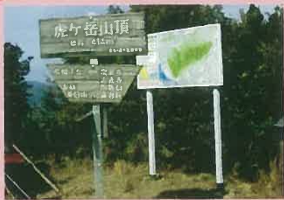
登山ルート図の作成・看板設置