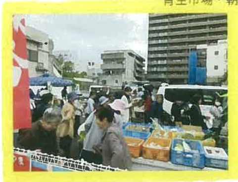
青空市場・朝市 (軽トラ市)