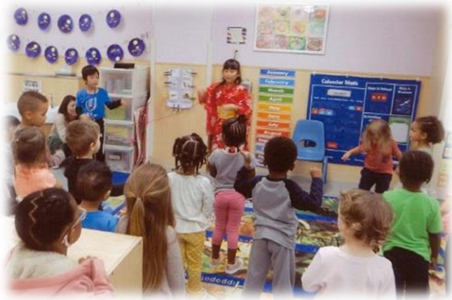
岩国基地 保育園を訪問 パブリカダンスをみんなで楽しみました！

毎年3月に開催している「ひなまつり国際交流会」では、きものの着付け体験や日本のあそび、もちつきなどを外国の子どもたちと楽しんでいます。言葉が通じなくてもジェスチャーで気持ちを伝えあったり、一緒に様々な体験をしたりすることで楽しく交流ができます。