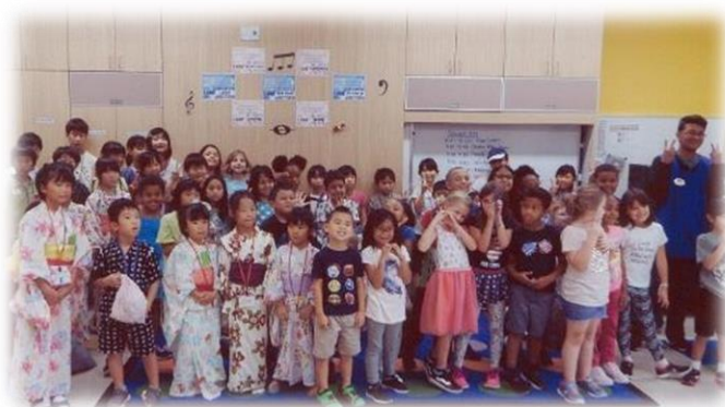
岩国基地 小学校を訪問 みんなで仲良く記念撮影

外国の文化を学んだり、体験したりすることができるイベントの案内がクラブから定期的に送られてくることも毎回楽しみです。先日岩国基地での「ハロウィンカーニバル」に参加したのですが、仮装も飾りつけもとても本格的で、とても印象に残っています！