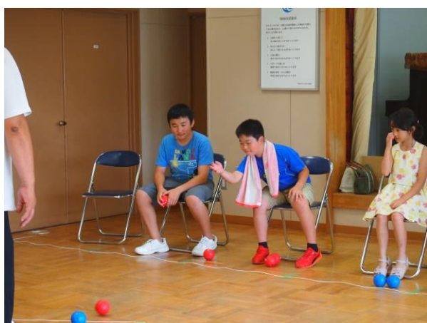
ボッチャ（パラリンピック版ペタンク）