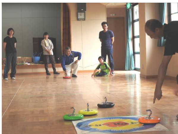
カローリング（床上版カーリング）

今回紹介されたスポーツは今後のスポーツ振興会の行事にも取り入れられるとのことですので楽しみに。