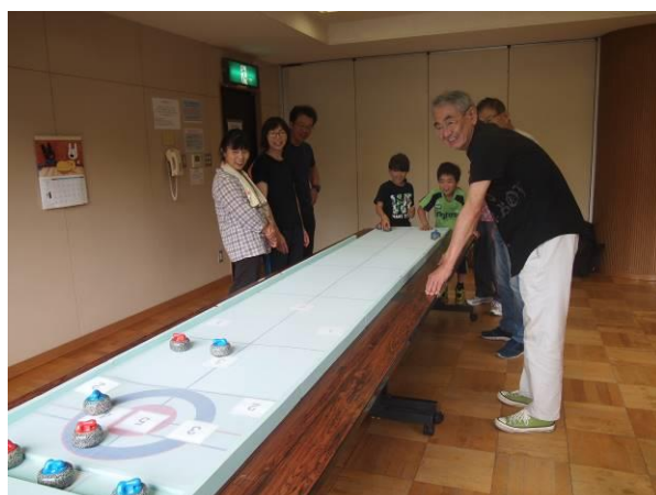
カーレット（卓上版カーリング）