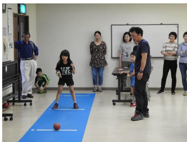
ビーンボウリング