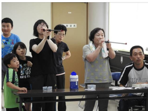
ヒューストン（健康吹き矢）