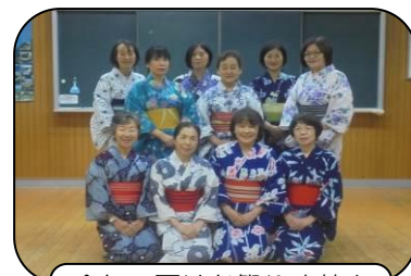
今年の夏はお祭りや花火などお出かけもバッチリです・・・

講習会の告知や募集は「広報しゅうなん」や「ふぁいんど」「メールしゅうなん」などに掲載し、地区内にはポスター掲示などを行いました。