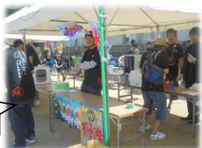
各種のバザーも大賑わい

6/16(日)岐山スポーツ振興会の主催で恒例の「き～さんスポ振フェスタ」が開催され、地域から主役の小学生86名を含め約300名の皆さんが参加されました。好天の中、わなげやヒューストン、フットゴルフなど多彩なゲームが準備され、参加した児童はそれぞれのゲームで得点を競い合いました。また、手作りパンやお菓子釣り、焼きそばなどのバザーも豊富で参加者も満喫しました。最後、「菓子まき」でフィナーレを迎え大盛況で終えることができました。スタッフの皆さん、お疲れ様でした。