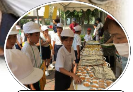
児童たちはいろいろな非常食を試食しました！ 美味しかったようです…

全国で様々な災害が発生していますので、地域全体で災害対応の意識を高めていかなければならないと思っています。この行事も年々充実させていく予定ですのでよろしくお願いいたします。