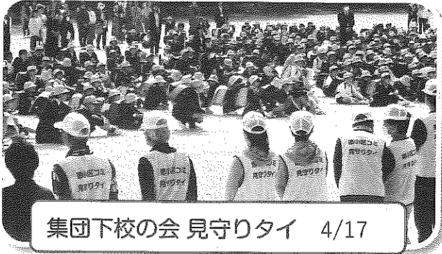
集団下校の会 見守りタイ 4/17