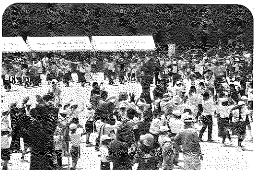
徳山小学校運動会 (市民ばやし) 5/25

徳山小学校で、また、市民センターとくやまで、子どもから大人まで様々な世代が集う行事や機会が、たくさんありました。これからも、同じ地域に住む人同士のコミュニケーションを深めながら、地域のきずなをさらに強くしていきたいものです。