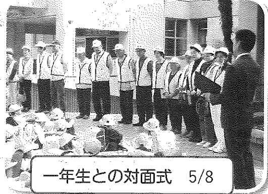
一年生との対面式 5/8