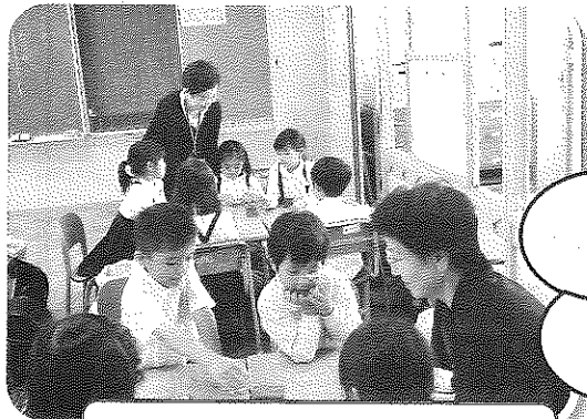
放課後子ども教室 5/15

徳山小学校で、また、市民センターとくやまで、子どもから大人まで様々な世代が集う行事や機会が、たくさんありました。これからも、同じ地域に住む人同士のコミュニケーションを深めながら、地域のきずなをさらに強くしていきたいものです。