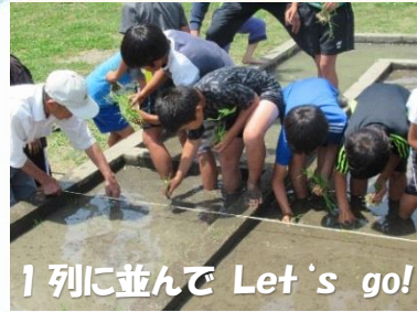
1列に並んで Let's go!

榑浜小では、六月六日（木）三・四時間目に五年生が、学 校田で田植えを体験。ぬかるむ田に足を取られながら、一 東三・四本に揃えられた苗を 一列に並んで一斉に植えてい きました。また、十日（月）に は、二年生がさつまいもの苗 植えを体験しました。秋には 大きな芋が収穫できるといい ですね。どちらも地域皆さん、 田んぼや畑の準備を、植え方 の指導、大変お疲れ様でした。