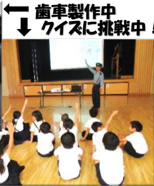
← 歯車製作中 ↓ クイズに挑戦中！