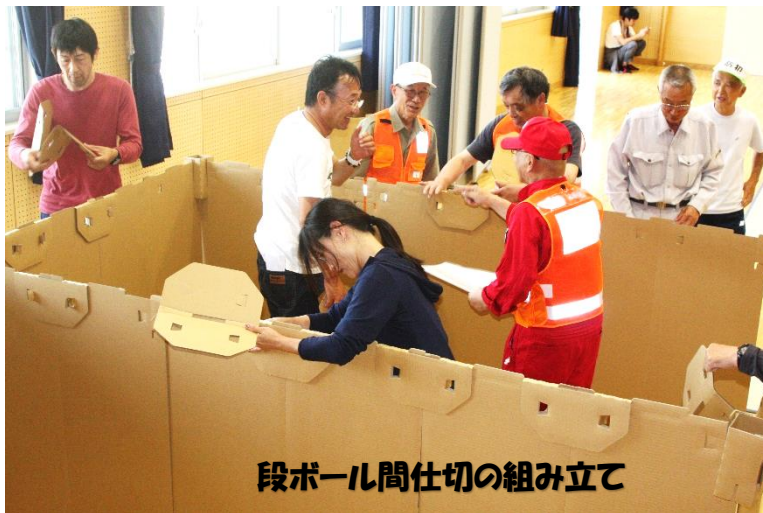
段ボール間仕切の組み立て

六月九日(日)、榑浜地区の自主防災研修会が市民センターと華西公園で実施されました。土砂災害の危険性のある自治会では、土のう作り訓練、その他の自治会の防災部長には、避難所運営訓練を体験して頂きました。