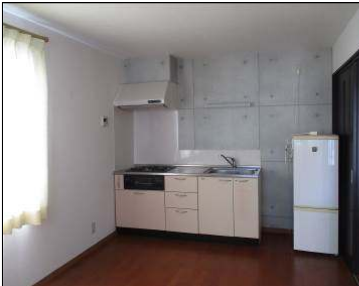
(ダイニング キッチン)