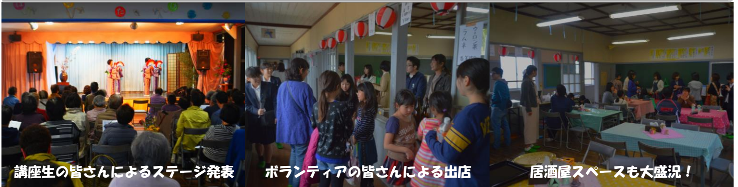
講座生の皆さんによるステージ発表