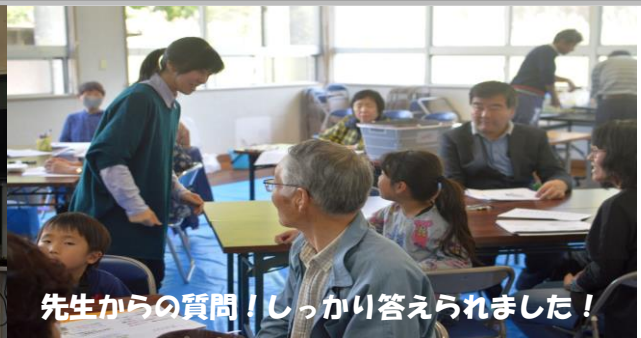
先生からの質問！しっかり答えられました！