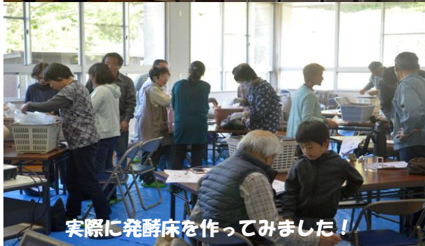
実際に発酵床を作ってみました！