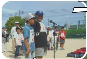
6年生2名の選手 宣誓で始めました