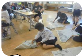
5/15は自分達で作ったゴミ袋を「きさんの里」に贈りました

尚、放課後子供教室では1年生はまず、学校になれることを優先し、参加募集は2学期から行いますのでよろしくお願い致します