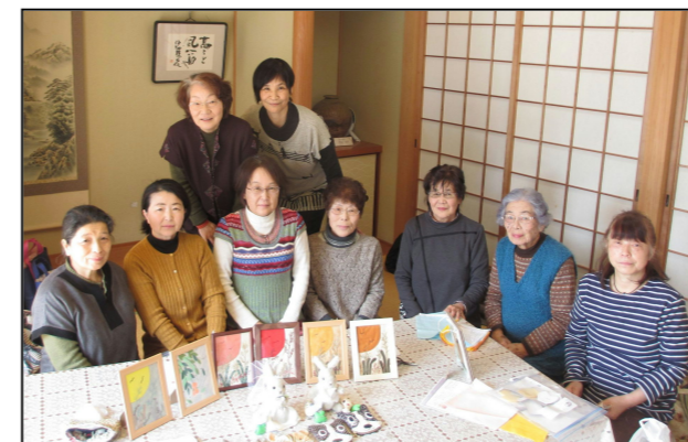
趣味の会のみなさん

先生もなし！強制作品もなし！ 個々が好きな作品を持ち寄り、ワイワイ言いながら楽しく活動しています。 年に一度のふるさと祭りの展示に向けて、一人一作品を目標に、話に花を咲かせながら頑張っています。