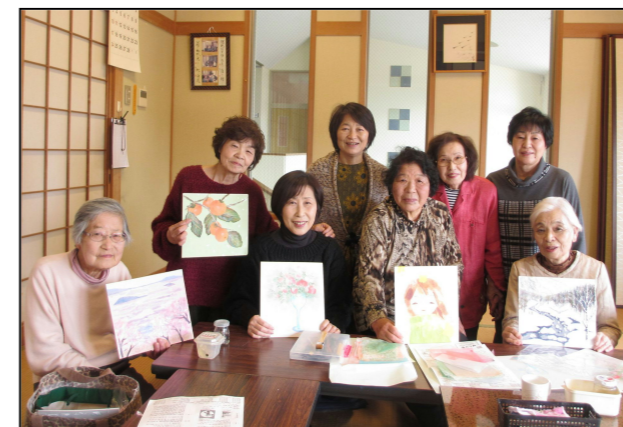
ちぎり絵教室のみなさん

ちぎり絵は、和紙をちぎって貼って絵を描きます。大雑把な人は大胆のびのびと、細かい人は繊細で美しい作品に仕上がった時は、感動と幸せな気持ちにしてくれます。 60歳代から80歳代の8人のメンバーで、おしゃべり、お茶しながら楽しく活動しています。手先を使うので認知症予防になりますよ！ぜひのぞいてみてください。