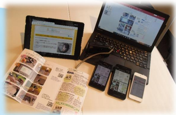
作成したリーフレット、ホームページ。様々なツールを使用して活動をサポートします！

所属団体の活動、まれに体調の関係にて頻繁な行事参加は難しいですが、情報収集にご協力いただける団体様がいらっしゃいましたら団体活動行事のお知らせ等、気軽にメール ( info@analog-kai.org ) でご連絡頂ければと思います。