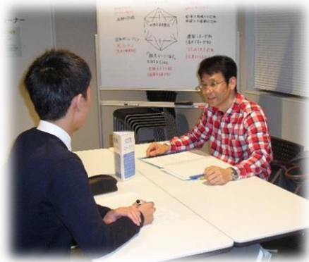
毎月 第1・第3 水曜日開催している活動の様子。

また、「だつきつ」に「だ」をつけると前から読んでも後ろからよんでも、同じ読み方の団体名になるため、印象に残りやすくくて良いと感じて「だつきつだ」という団体名にしました。