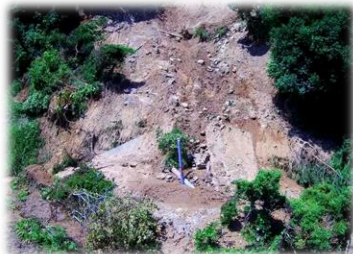
西日本豪雨災害被害状況