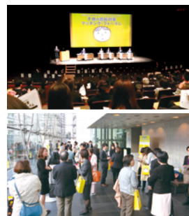
2017年度までに全国11ヶ所で開催