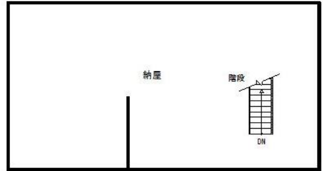
納屋 2階平面図 S=1/100