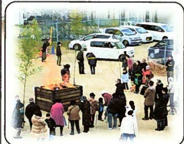
勢いよく燃え上がる炎

1月12日(土) どんど焼き 今年も恒例のどんど焼きが行われました。遠石八幡宮の宮司さんに今年一年の家内安全・無病息災を祈願していただいた後、しめ縄などに火が入り勢いよく燃え上がりました。今年は小学生が積極的に参加して保護者の方々のお手伝いも多く、学校と地域のふれあいを特に感じました。行事を通して学校と地域とのつながりが強くなれば周陽地区も安心できます。最後に参加者全員にぜんざいと紅白もちが配られました。