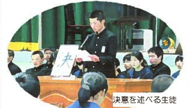
決意を述べる生徒

1月16日(水) 周陽中学校体育館において2年生の立志式が行われました。これは昔の元服、また論語の「吾十有五にして学に志す」にちなみ数え年15歳になる中学2年生が人生の目標を立てる儀式です。厳かな雰囲気の中、2年生全員が生徒や保護者の前で一人づつ自分の志を発表し決意を述べました。