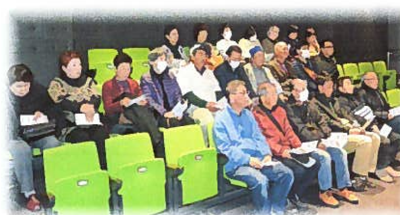
シアターで災害の疑似体験中