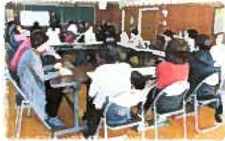
1/25 ブロック別で協賛

日時 3月2日(土) 午前9時30分から 内容 展示発表、舞台発表、各種バザー、餅まき等 ※詳しくは同封のチラシをご覧ください。