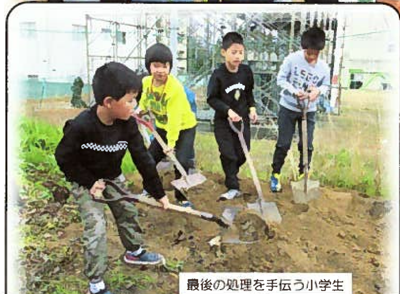
最後の処理を手伝う小学生