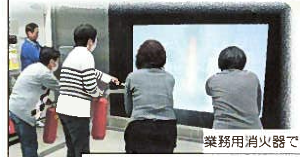
業務用消火器で消火体験

心配していた雨に降られることもなく、あたたかくお天気に恵まれた一日でした。 岩国防災学習館の体験で一番心に残ったのはなんと「震動」も地震体験でした。中でも東日本大震災で起きたもの(の体験)は忘れられない程の恐ろしさで、経験された方の怖さはいかばかりであったろうと思うと同時に、自分たちの防災に対する意識をもっと高めなくてはと感じました。煙からの逃げ方や消火器の使用方も再確認でき、とても有意義な研修でした。