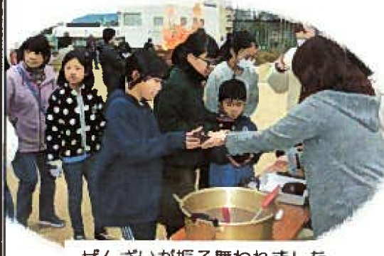
ぜんざいが振る舞われました

1月12日(土) どんど焼き 今年も恒例のどんど焼きが行われました。遠石八幡宮の宮司さんに今年一年の家内安全・無病息災を祈願していただいた後、しめ縄などに火が入り勢いよく燃え上がりました。今年は小学生が積極的に参加して保護者の方々のお手伝いも多く、学校と地域のふれあいを特に感じました。行事を通して学校と地域とのつながりが強くなれば周陽地区も安心できます。最後に参加者全員にぜんざいと紅白もちが配られました。