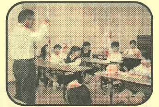
(英語であそぼうタイム)