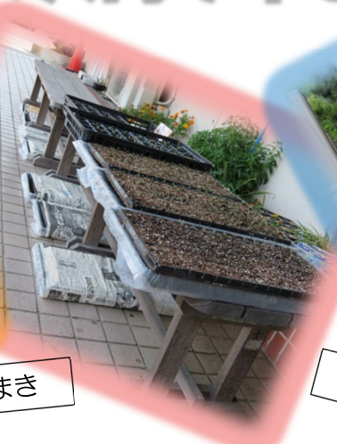
市民センターのストック