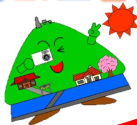
桜の横を走る小学校の部

4月8日（日）の向道湖マラソン大会では、地域のみんで交通整理や屋台、お弁当やうどんの販売に餅まきなど、頑張って盛り上げたよ!!