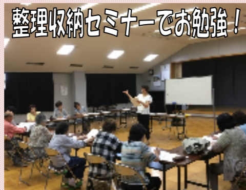
整理収納セミナーでお勉強!