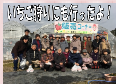
いちご狩りにも行ったよ!