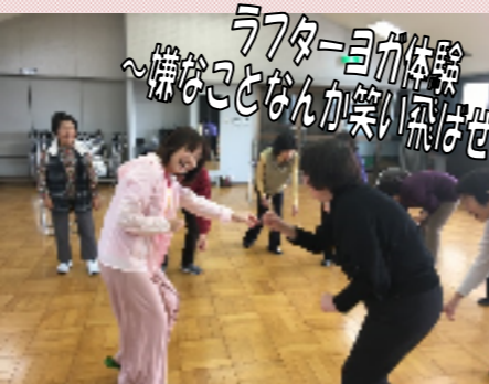
ラフターヨガ体験 ~嫌なことなんか笑い飛ばせ!~

新規受講希望者は下記申込書を三丘市民センターまで! ※継続の方は申込不要! 電話でもOK! 締切5月25日(金)まで!!