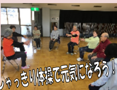
しゃっきり体操で元気になろう!