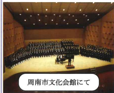
周南市文化会館にて

新年おめでとうございます。地域の皆様方の支えにより、太華中学校生徒は、昨年も多方面で力を発揮し、活躍することができました。