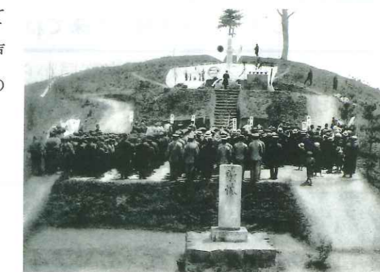
この写真は、大正9年の日付と陸軍の名が刻まれており、中央上部に見える忠魂碑の竣工式ではないかと語られています。