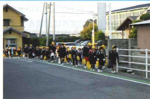
今年も笑顔いっぱいの久米地区に朝の登校の様子