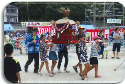
【夏まつりの子どもみこし】

本校の児童が、将来少しでもその力になれるよう、地域について考え、貢献できる活動に取り組んでいきたいと思っています。