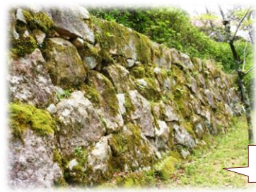
亀居城石垣 築城は武将:福島正則