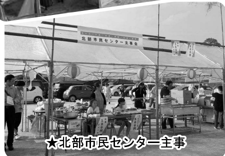
★北部市民センター主事

◎地区の皆様から提供していただいた新じゃがいもは合計221kgでした。ご協力ありがとうございました。