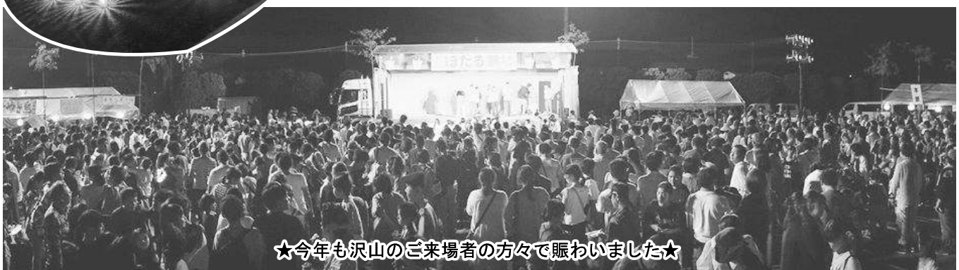
★今年も沢山の来場者の方々に賑わいました★