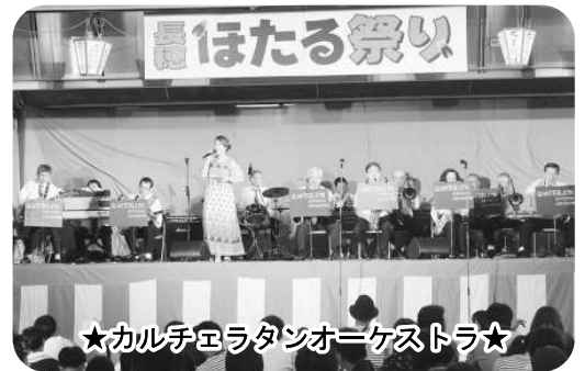
★カルテュラタンオーケストラ★