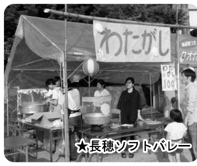
★長穂ソフトバレー