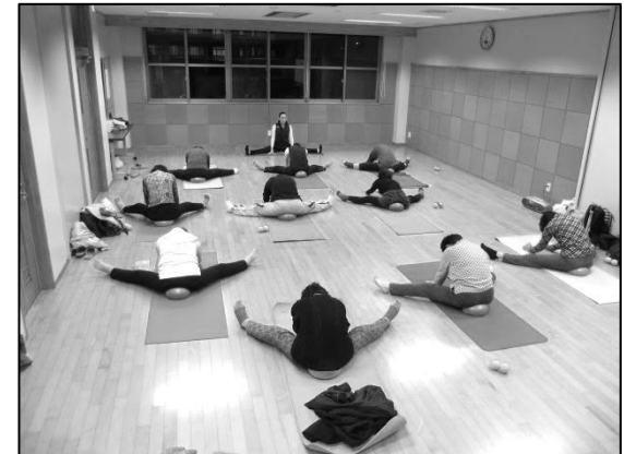
▲講座の様子 3月1日(木)の講座の様子。写真撮影時にもごやかな雰囲気が伝わってきました。

身体の状態は日によって、また気圧や天候によっても変わります。それらを加味し、レッスンのメニューが決まります。先生は、自分の身体の事や癖を知るところを力説されます。長い間に凝り固まった筋肉や普段使わない筋肉を動かし、ほぐしていくことによって、長く元気で「HAPPY LIFE!」年の差も関係なく、和気あいあいと楽しい講座です。一品持ち寄りのお花見や三味線とコラボのレッスンの予定もあり、楽しみです。興味のある方はまず、体験受講してみませんか？