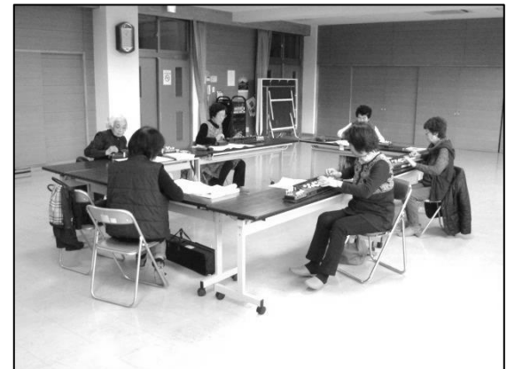
▲講座の様子 3月9日(金)の講座の様子。会員7名での練習風景です。この日は「春の小川」、「君恋し」の2曲を練習しました。