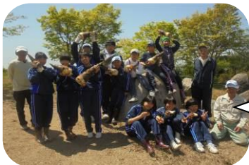
自分で収穫した「たけの子」を持って記念撮影

尚、放課後子供教室では1年生はまず、学校になれることを優先し、参加募集は2学期から行いますので楽しみに・・・