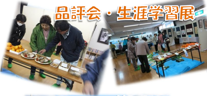
品評会・生涯学習展