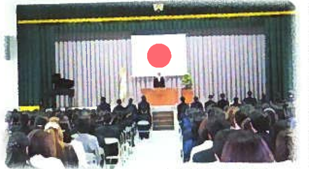
中学校入学式の様子

子ども達の新しい一歩である入学式が、それぞれ行われました。初々しい1年生の晴れやかな顔はとても輝いていました。ご入学おめでとうございます。未来を背負う子ども達の健やかな成長は地域全体の願いです。しっかり見守っていきましょう。