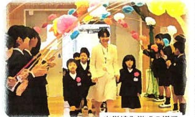
小学校入学式の様子