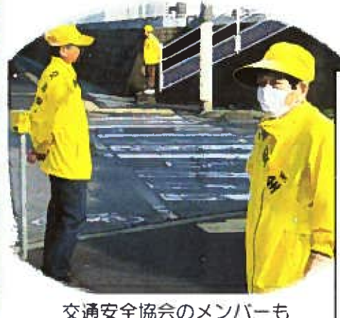
交通安全協会のメンバーも