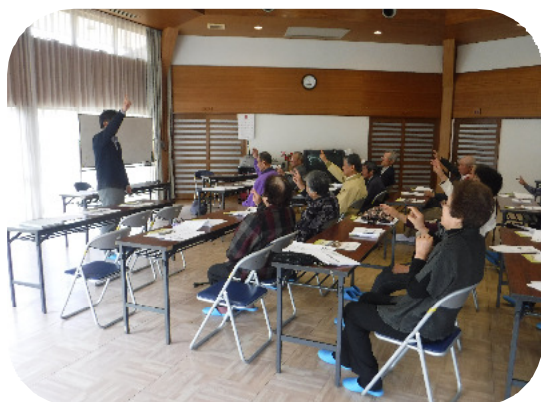
講座の最後に行われた認知症予防体操

認知症になりにくい生活習慣には、「野菜・果物（ビタミンC、E、βカロチン）、魚（DHA、EPA）をよく食べる」「人とよくお付き合いをする」「文章を書く・読む」等）があり、また、認知症で落ちる3つの能力を簡単なトレーニング（日記をつける、囲碁・将棋等頭を使うゲームをする等）で鍛えることで、この習慣を長く続けると、認知症を発症せずに過ごせたり、認知症になる時期を遅らせたりできる可能性が高まるとされています。