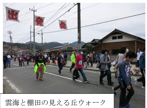
雲海と棚田の見える丘ウォーク

雨天や桜の開花の遅さが心配されましたが、当日は天候や桜の開花にも恵まれ、大勢の選手が沿道からの声援を受けながら駆け抜けていました。