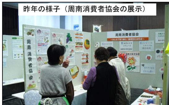
昨年の様子(周南消費者協会の展示)