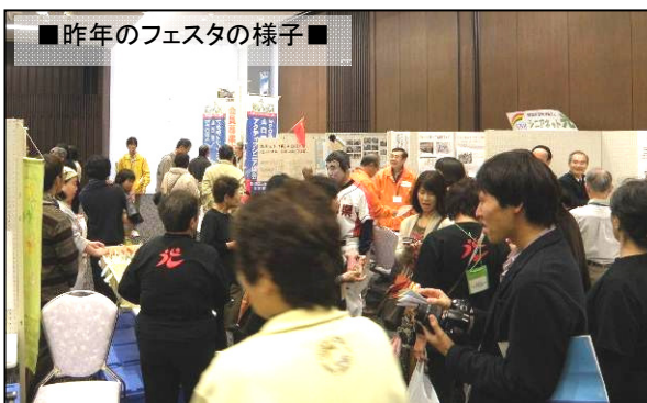
■昨年のフェスタの様子■