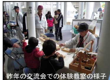
昨年の交流会での体験教室の様子