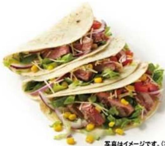
写真はイメージです。(笑)