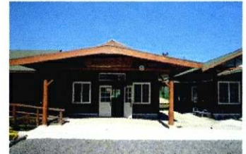
ふれあいの森なんでも工房