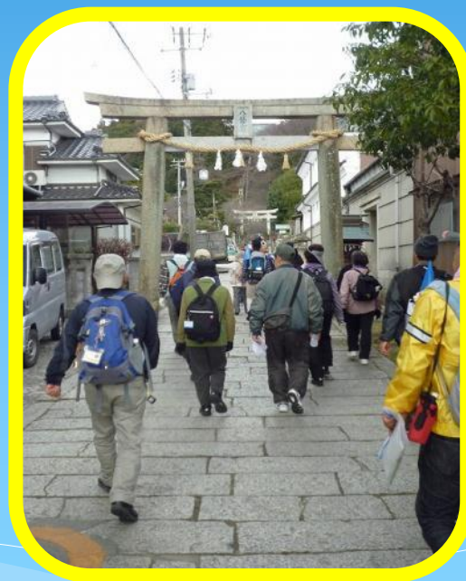
●平成24年1月7日 第17回ウォーキング月例会 「新春！初歩き」新年最初のウォーキングは参加者54 名、距離12キロ。遠石八幡宮参拝後、下松市に入り花岡 八幡宮に到着、参道から参拝に向かいました。