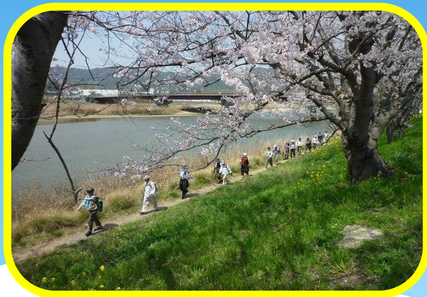
●平成23年4月10日 第8回ウォーキング月例会 光市島田川沿い 桜の季節

http://www.city.shunan.lg.jp/hp/shientent/shimin/abshosai.php?tourokubangou=417