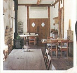
G 創作イタリアン&カフェ BOSCO 吹き抜けと露ストープが気持ちいい。女性を中心に人気のイタリアンレストランです。敷地内にはハンドメイドの雑貨屋もあります。