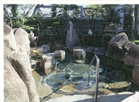
E バーデンハウス三丘 11種類の浴槽を備えた100%天然温泉。おいしい食事、全天然芝5コース40ホールの広大なグラウンド・ゴルフ場もあります。