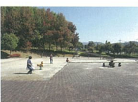
C 徳修公園 広い公園内には遊具や孔子をまつた聖廟が残る県指定有形文化財の徳修館があります。秋には徳修館まつりで開催されます。